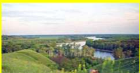
«Край родной, как ты прекрасен»