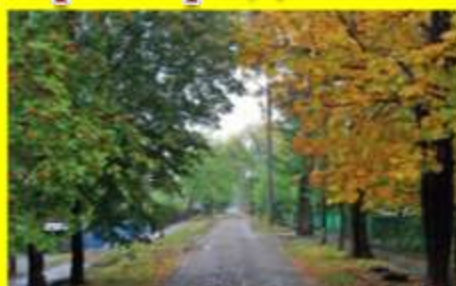
«Улицы нашего города»