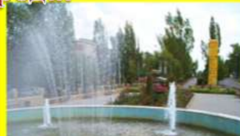
«От лазоревых степей к шахтерскому городу»