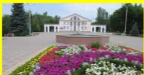
«От лазоревых степей к шахтерскому городу»