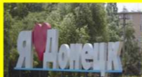
«Мой город самый красивый»