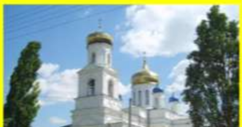
«От лазоревых степей к шахтерскому городу»