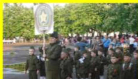
«Помним и чтим»