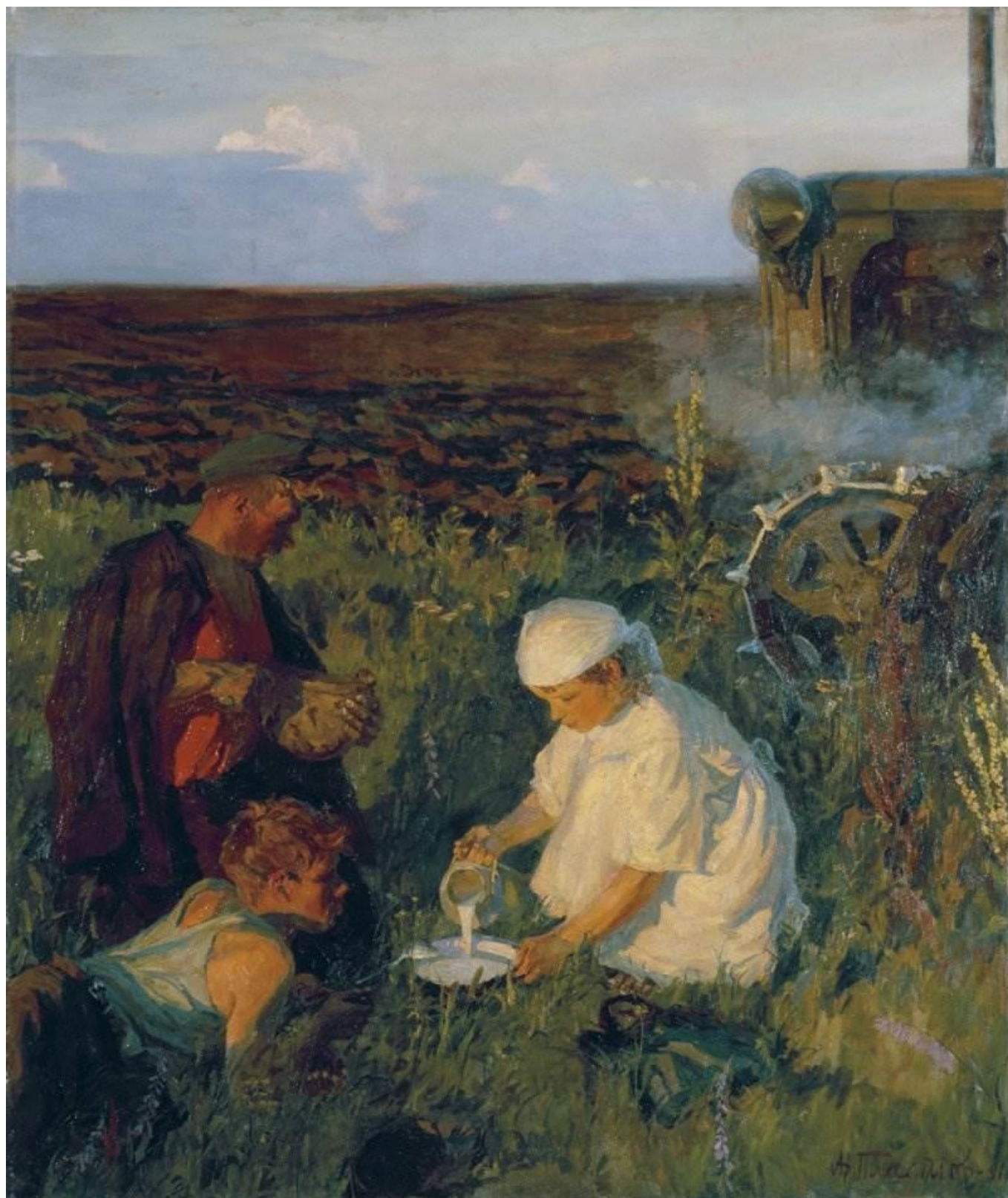
Пластов «Ужин трактористов».